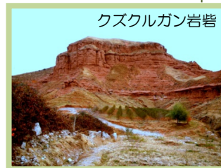
クズクルガン岩壁